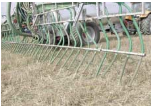
Figura 3. Aplicación de purín mediante el método de rampa con tubos colgantes

El sistema de tubos colgantes ( Figura 3 ) está constituido por una tubería general que sale de la cuba, conectada a un triturador-distribuidor que abastece a distintas mangueras que cuelgan sobre un soporte de acero (plegable para el transporte) y distan entre sí alrededor de 20-30 cm. Estas mangueras tienen un diámetro de 4-6 cm, por lo que precisan del triturador-distribuidor para evitar obturaciones, y depositan el purín directamente sobre el suelo.