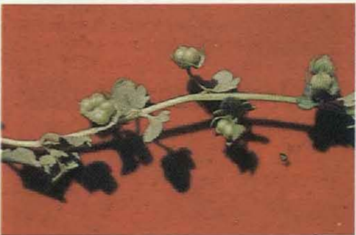
Detalle de una rama con frutos. 4 semillas por fruto.