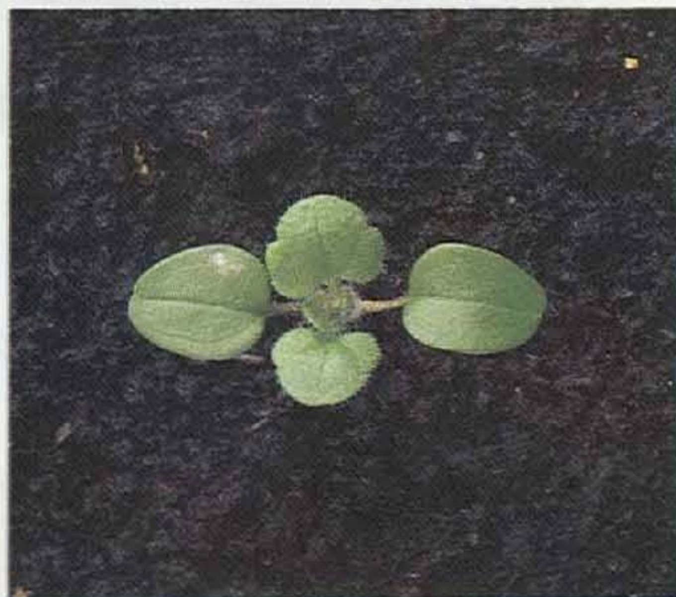
Estado de plántula. Cotiledones y primeras hojas.

Planta anual de germinación escalonada de otoño a invierno. Su floración se produce en enero-febrero