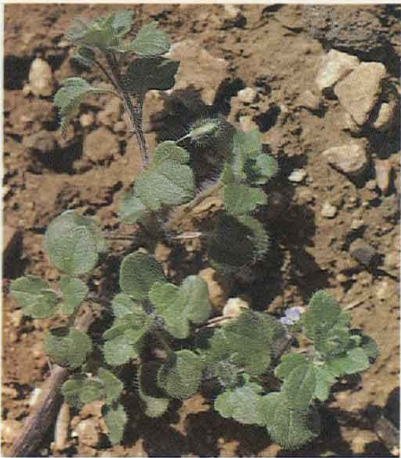
Estado adulto. Porte rastrero y flores blanco-azuladas.